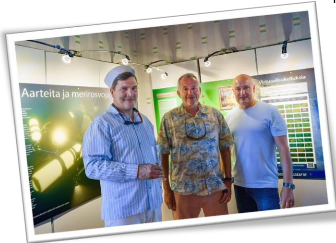
Näyttelytiimi Nötön näyttelyn avajaisissa

MAS aloitti oman näyttelytoimintansa kesällä 2024 Nötön vanhan koulun galleriassa. Vaikka kyseessä oli eräänlainen kenraaliharjoitus Suomenlinnan Merisalissa kesällä 2025 pidettävää näyttelyä varten, tutustuivat monet Saaristomerellä kesälomaansa viettäneet kansalaiset näyttelyyn, joka sai paljon positiivista palautetta. Myös ministeri Adlercreutz seurueineen oli tutustunut näyttelyyn ja jättänyt kannustavan merkintänsä vieraskirjaan.