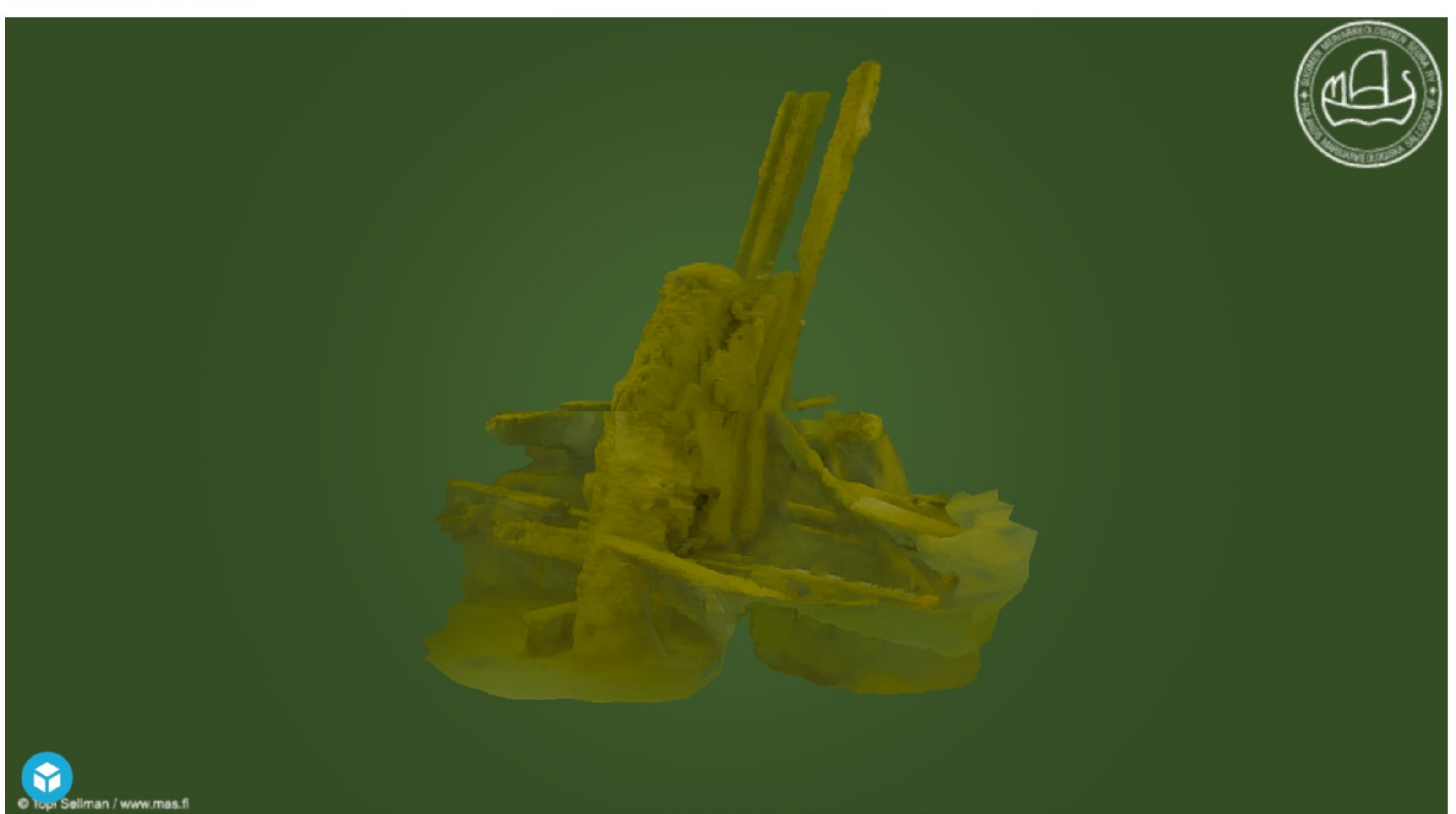
Shipwreck Jollahylky (Kotka) by Suomen Meriarkeologinen Seura ry. on Sketchfab