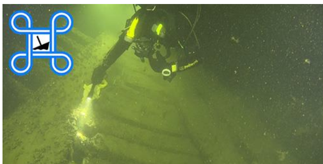
1. Sukeltaja tutkii hylkyä ja puhuu pintaan ulträänipuhelimella.

”Hylkyjen lastina on pääasiassa tarinoita!”