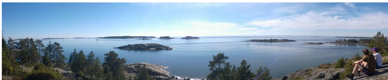
5. näkymä Porkkalan Pampskatanin kallioilta Hylkypuiston saaristoon

Porkkalan Hylkypuiston projektipäällikkö